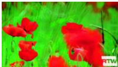
Wallpaper Sand B1